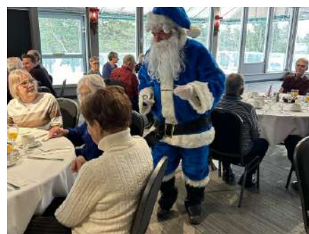
Photo prise lors du brunch de Noël