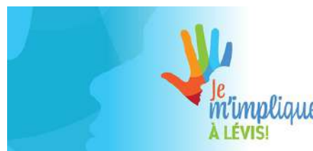
La journée internationale des bénévoles

Cette année, pour la 38e édition de la Journée internationale des bénévoles qui a eu lieu le 5 décembre 2023, nous sommes passés par différents outils de promotion pour faire savoir aux bénévoles de Lévis notre appréciation. Nous avons donc mis en place plusieurs actions de promotion durant cette journée pour souligner et remercier l'implication bénévole des citoyens lévisiens.