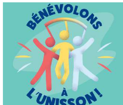
Promotion de la semaine de l'action bénévole 2023

Pour la 49e édition de la semaine de l'action bénévole , des actions de promotion dans les journaux locaux et en ligne ont été mises en place afin de reconnaître l'implication essentielle des bénévoles. Nous avons aussi facilité les commandes de matériel promotionnel pour nos organismes membres, et participé à l'organisation de divers activités de reconnaissance pour les bénévoles.