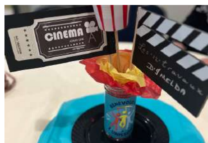
Lotbinière: Soirée cinéma