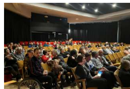
Bellechasse: Gala de reconnaissance